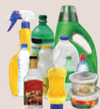
Botellas y Contenedores de Plastico