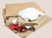
Cajas y Cartón Aplando